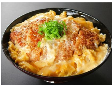
カツ丼 味噌汁・漬物付 790円