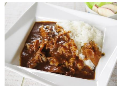
ビーフカレー 630円大盛810円 ミニサラダ付