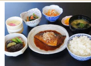
山海定食 990円 魚料理・煮物・小鉢二種・茶碗蒸し・ご飯・味噌汁・漬物