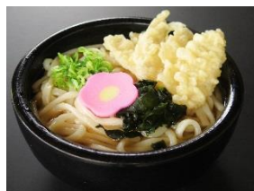
ごぼう天うどん 590円 ※そばもできます。