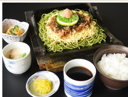
瓦そば定食 1200円 瓦そば・小鉢・茶碗蒸し・ご飯・香の物