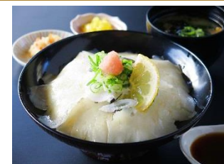
ぶっかけ満福井 1280円 ぶっかけ河豚井・小鉢・味噌汁・香の物