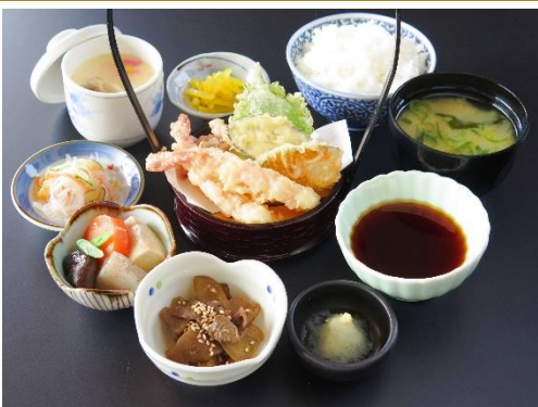
豊田ふるさと御膳 1280円 天ぷら盛合せ・煮物・和え物・ジビエ料理・茶碗蒸し・味噌汁・香の物・ご飯