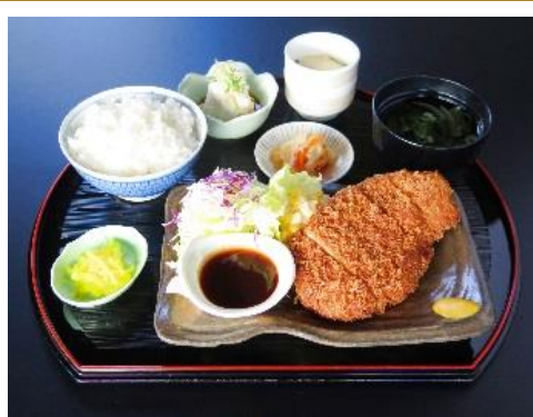
萬かつ御膳 1190円 こだわりとんかつ・おぼろ豆腐・小鉢・茶碗蒸し・ご飯・味噌汁・香の物