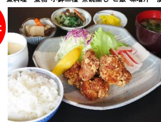
鶏唐揚げ定食 990円 鶏唐揚・小鉢・茶碗蒸し・和え物・ご飯・味噌汁・漬物

※うどんはそばと同じ釜で茹でているため「そばアレルギー」の方はスタッフにお申し付け下さい。