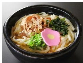
肉うどん 590円 ※そばもできます。