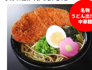
万作とんかつそば 840円