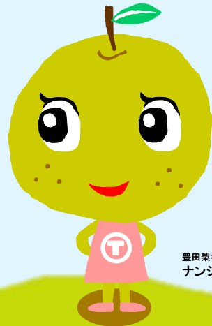
豊田梨キャラクター ナンシーちゃん