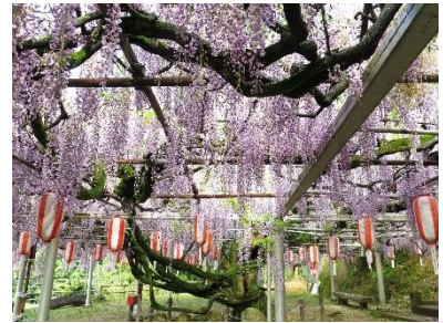
至一の俣温泉・角島