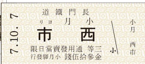
▲長門鉄道復刻切符1枚150円