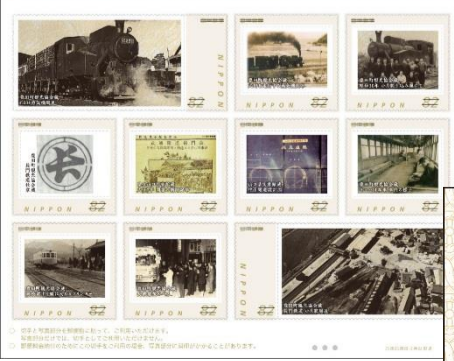
▲長門鉄道開通100周年記念切手シート1300円