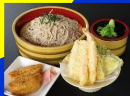
天ざる蕎麦セット