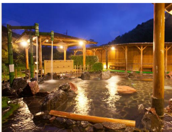
一の俣温泉グランドホテル TEL.083-768-0321 下関市豊田町大字一ノ俣15