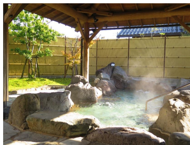
蛍街道西ノ市 西ノ市温泉 蛍の湯 TEL.083-767-0241 下関市豊田町大字中村876-4